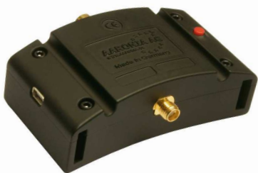
Vista de atrás